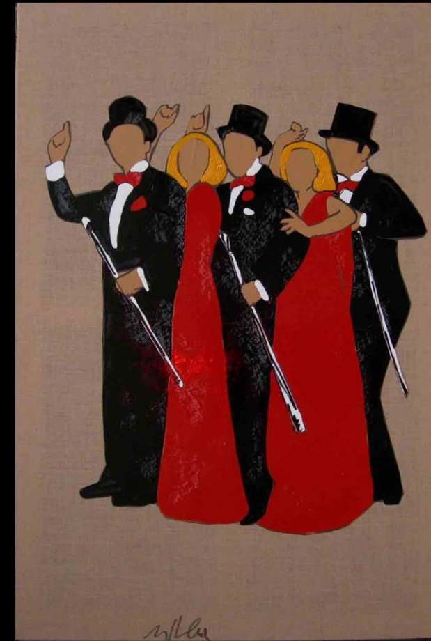
Tecnica mista su tela in juta, cm 150x100