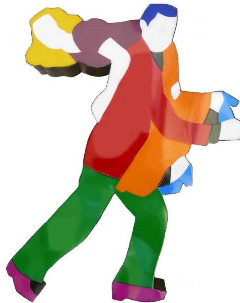
Scultura luminose in perspex e neon da parete cm 90x70