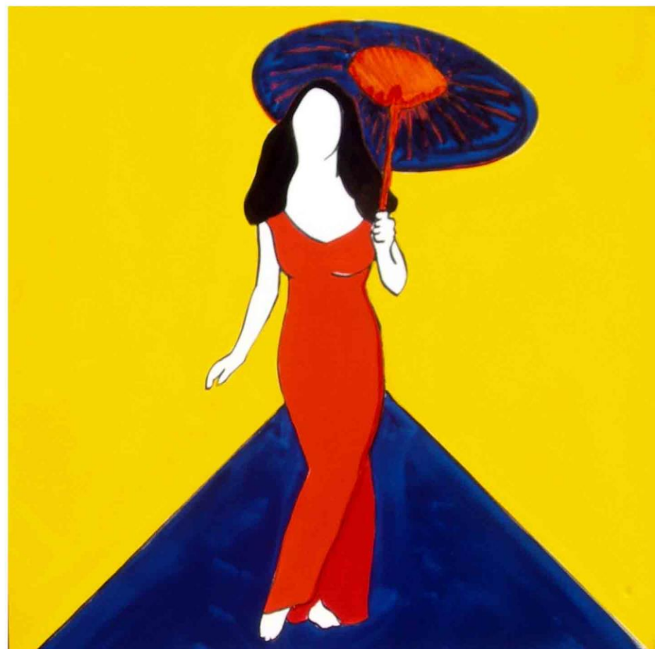
Tecnica mista su tela, cm 100x100