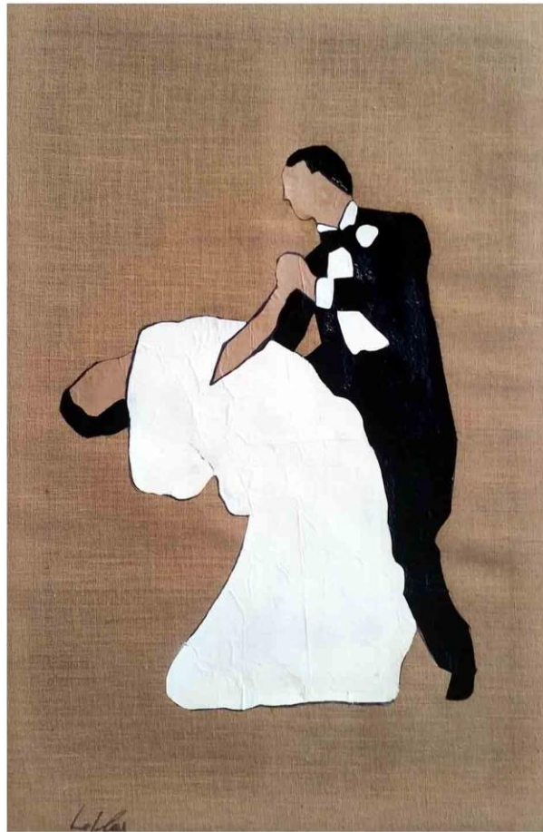
Tecnica mista su tela in juta, cm 145x95