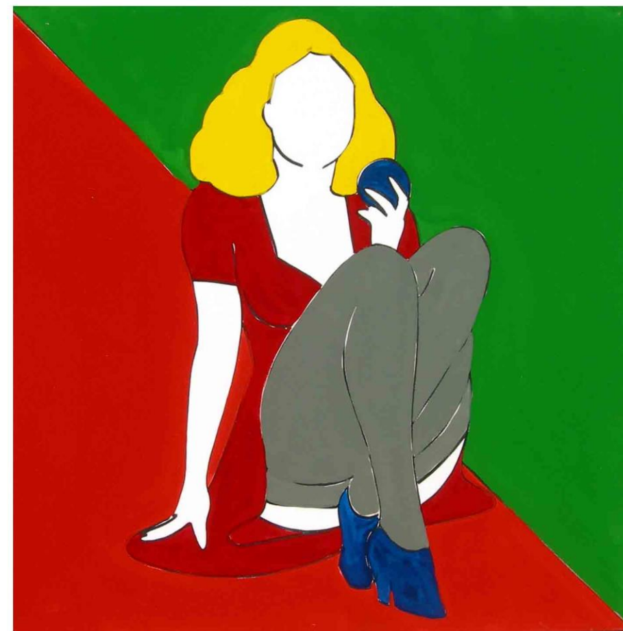
Tecnica mista su tela, cm 100x100