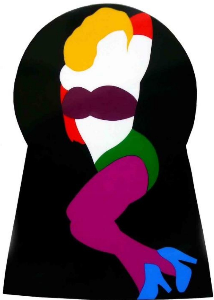
Scultura luminose in perspex e neon da parete cm 129x92