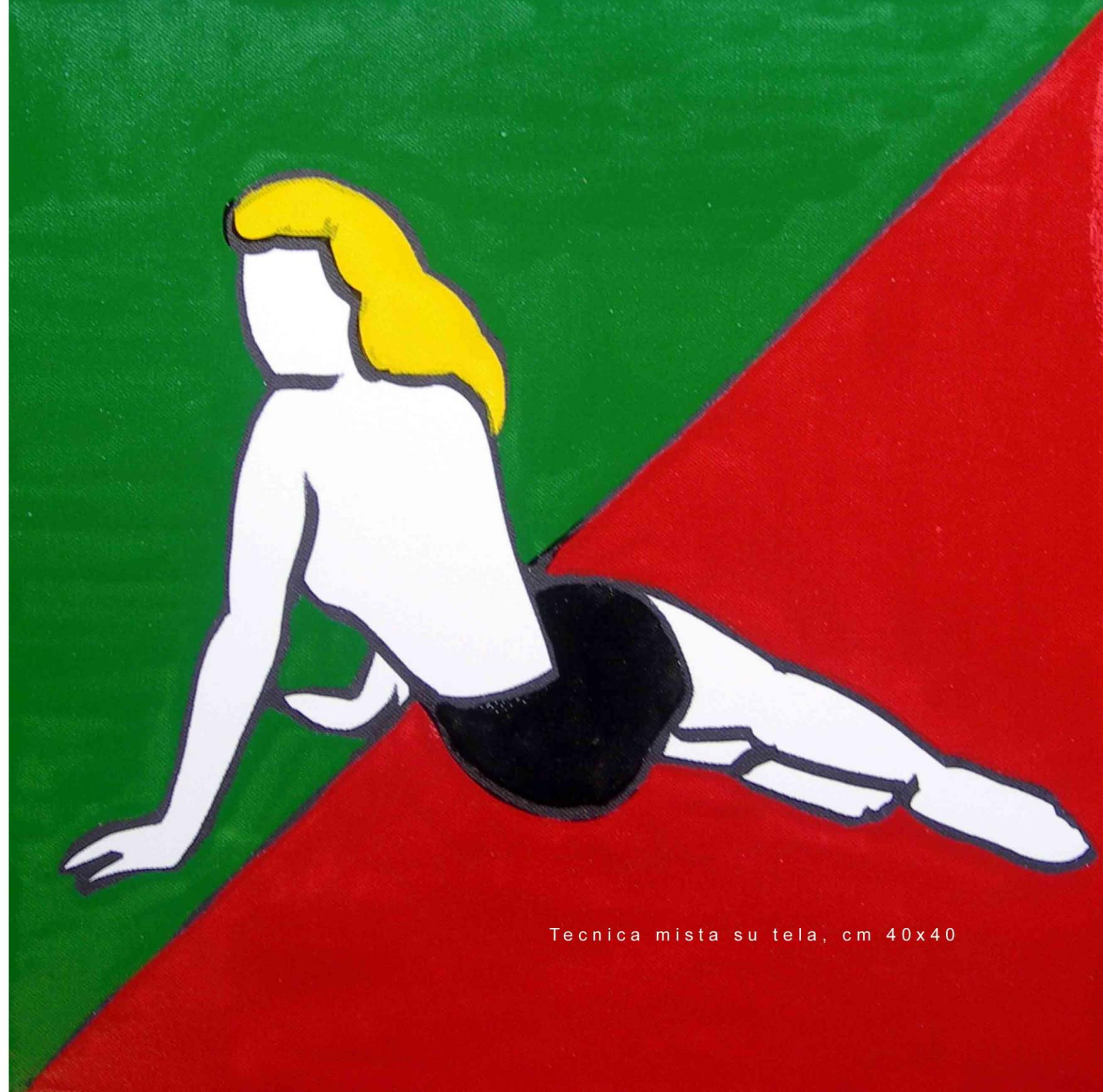
Tecnica mista su tela, cm 40x40