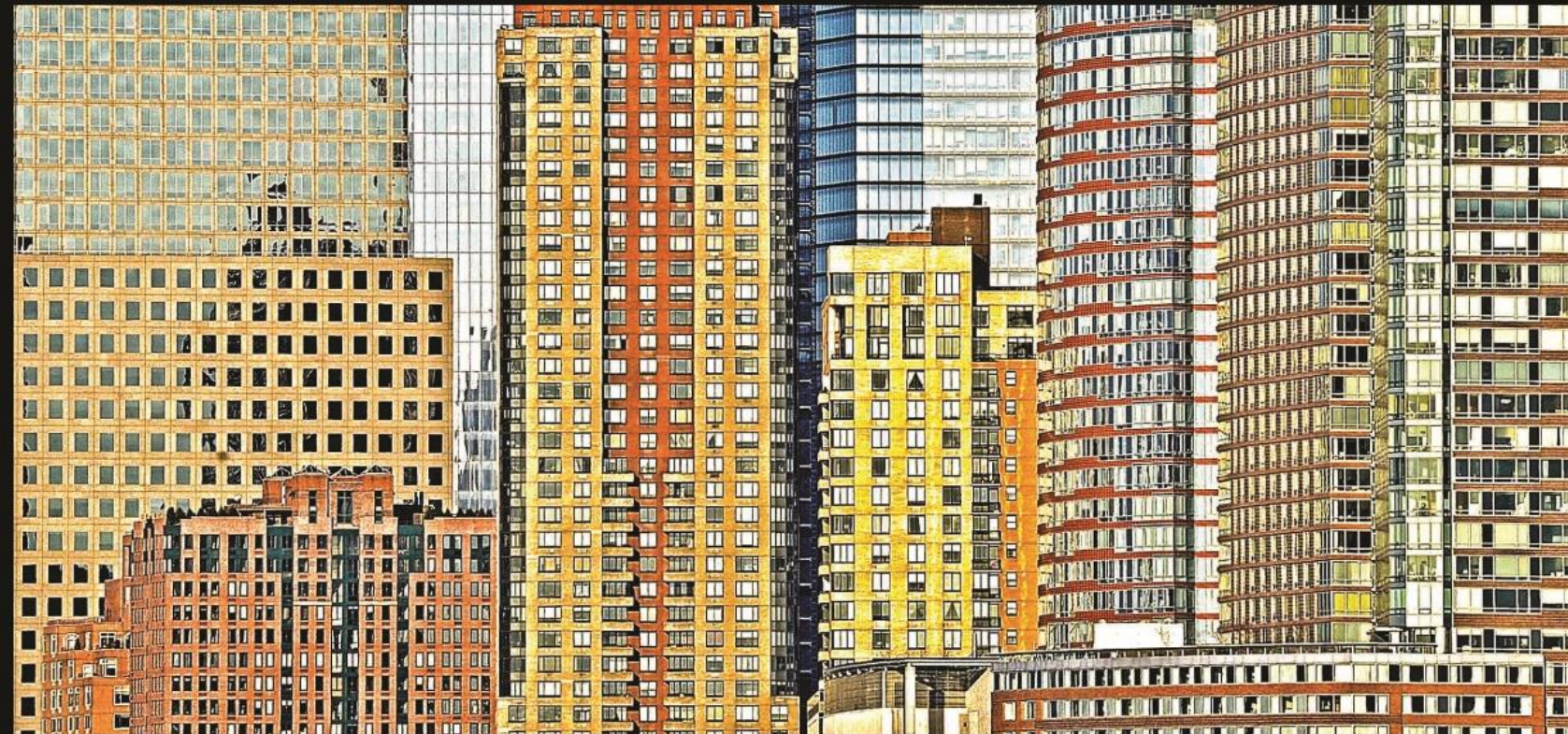
Wintown Remake, New York 2013 | Serie Citypatterns Stampa fineart su Plexiglas, cm 70x140