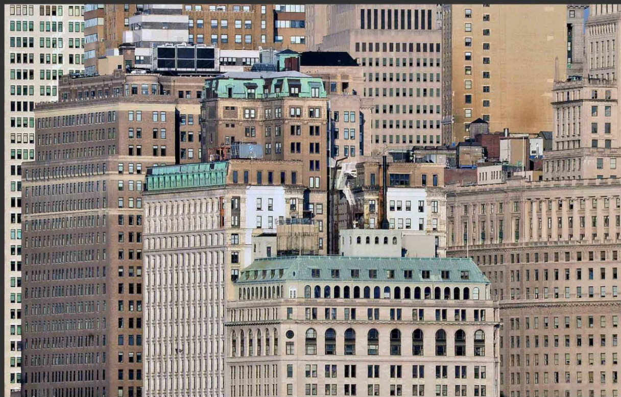
Once upon a time, New York 2013 | Serie Citypatterns Stampa fineart su Alluminio montato su Dibond, cm 50x70