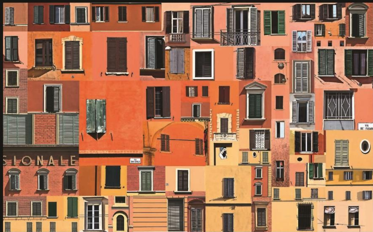
Bologna la Calda, Bologna 2017 | Serie Citypatchworks Stampa fineart su tela, cm 50x80