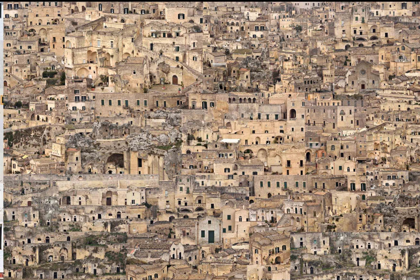
Storie di Sassi, Matera 2018 | Serie Citypatchworks. Stampa fineart su tela, cm 50x70