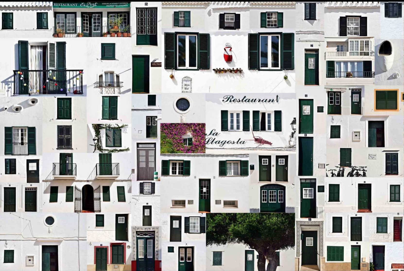
Blanc i Verd, Minorca 2017 | Serie Citypatchworks. Stampa fineart su tela, cm 50x70