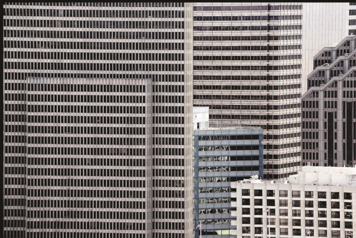
San Francisco, San Francisco 2015 | Serie Citypatterns Stampa fineart su Alluminio montato su Dibond, cm 50x70