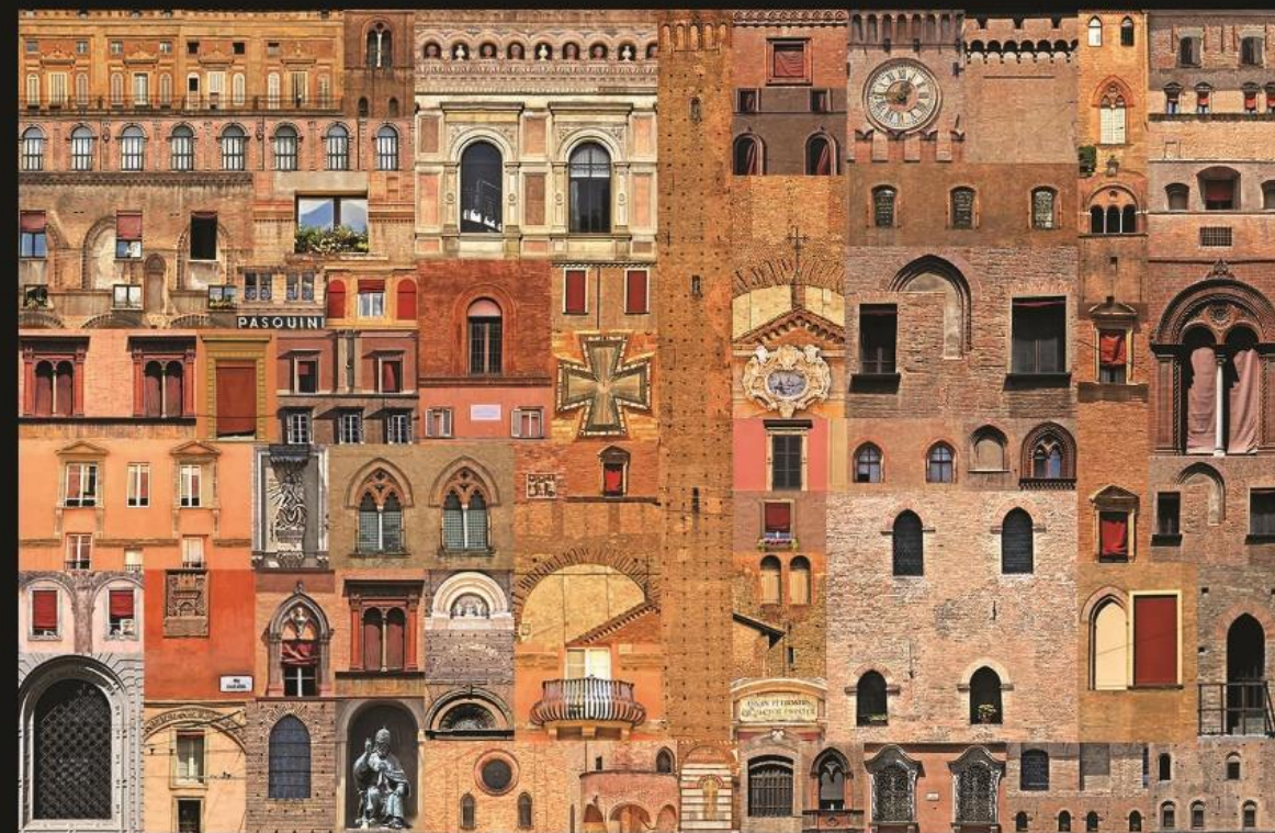
Bologna l'Antica, Bologna 2017 | Serie Citypatchworks Stampa fineart su tela, cm 50x70