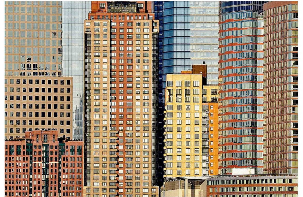
Windowtown, New York 2013 | Serie Citypatterns Stampa fineart su Alluminio montato su Dibond, cm 50x70