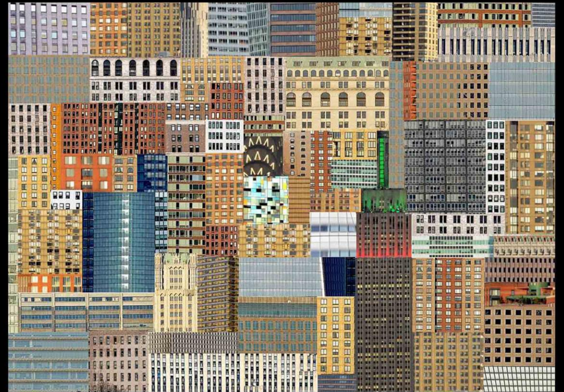
New York Puzzle, New York 2017 | Serie Citypatchworks Stampa fineart su Alluminio montato su Dibond, cm 50x70